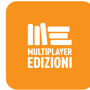
Altezza e larghezza minima 24 px