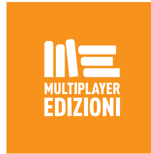
Altezza e larghezza minima 24 px